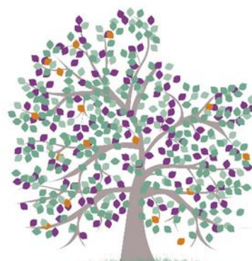
De beroemdste boom van Rosmalen